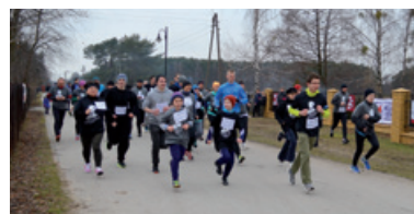
Tropem wilczym. Bieg Pamięci Żołnierzy Wyklętych