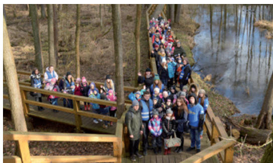
Podopieczni Arki na Królewskich Źródłach