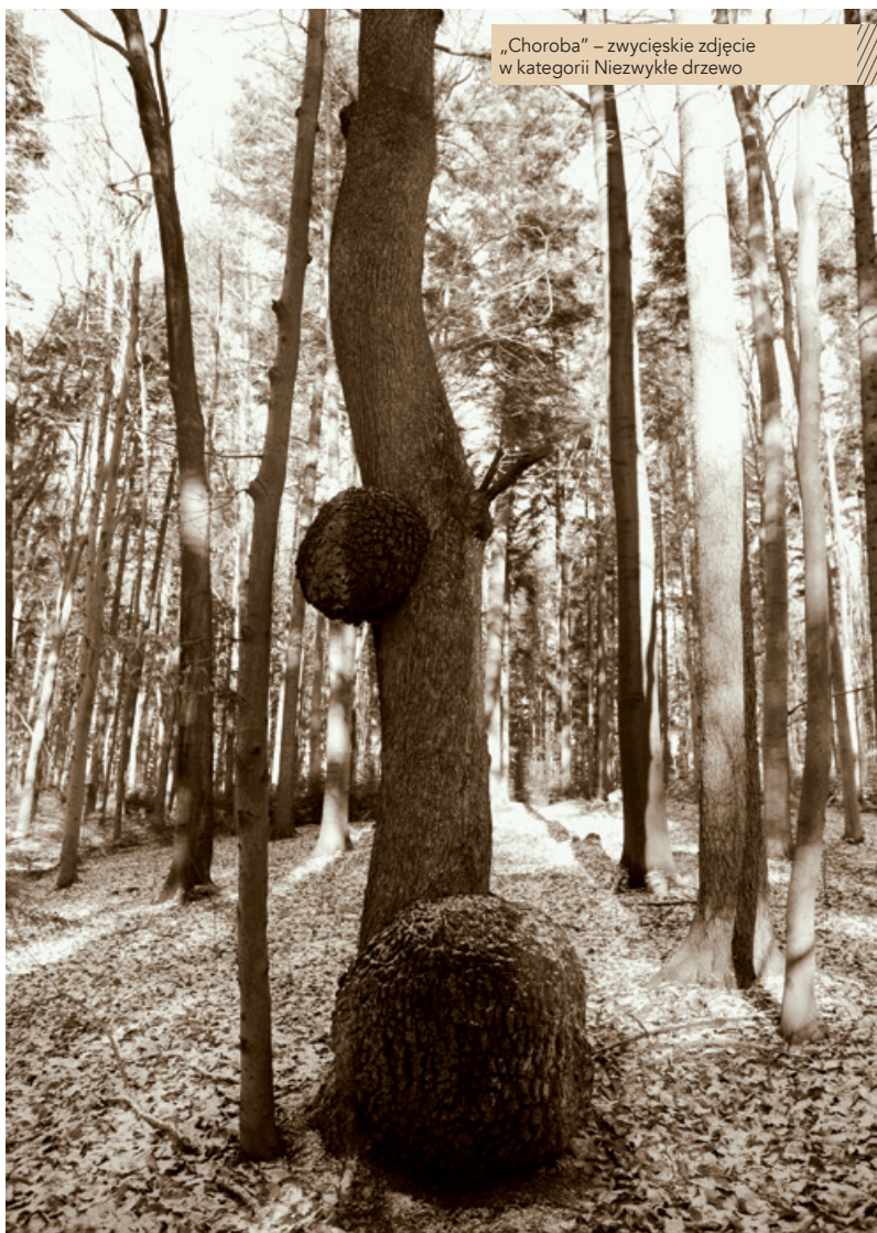
„Choroba” – zwycięskie zdjęcie w kategorii Niezwykłe drzewo