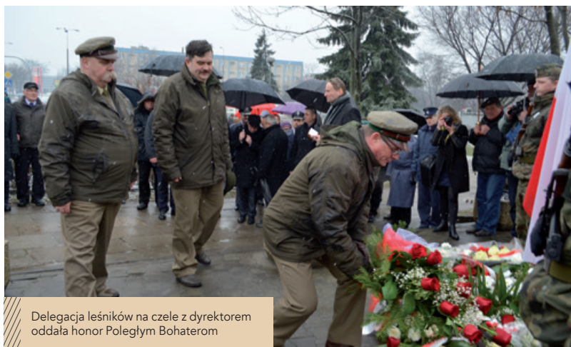
Delegacja leśników na czele z dyrektorem oddała honor Poległym Bohaterom

Pięć lat temu Sejm ustanowił Narodowy Dzień Pamięci „Żołnierzy Wyklętych”. W obchody święta włączyli się leśnicy, przyczyniając się do podtrzymania pamięci o wydarzeniach, które w dużej części działy się w radomsko-kieleckich lasach i w których brali udział leśnicy.