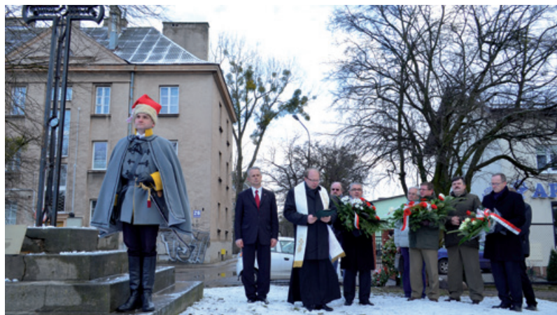
Delegacja leśników z RDLP w Radomiu złożyła kwiaty przy krzyżu powstańczych straceń