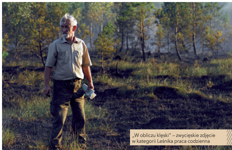
„W obliczu kłęski” – zwycięskie zdjęcie w kategorii Leśnika praca codzienna