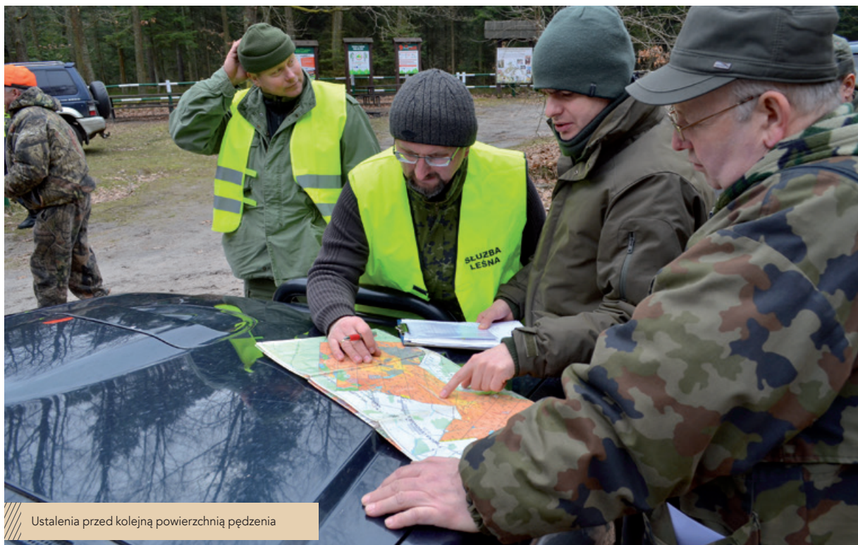
Ustalenia przed kolejną powierzchnią pędzenia