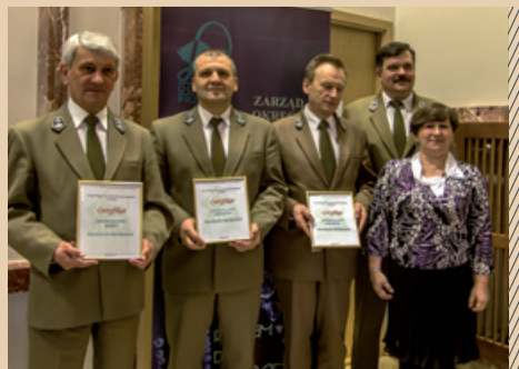
Nadleśniczowie odebrali certyfikaty „Nadleśnictwo Przyjazne Przyrodzie”